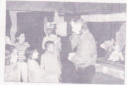
Les enfants sont curieux de connaître l'avenir de Piccolo