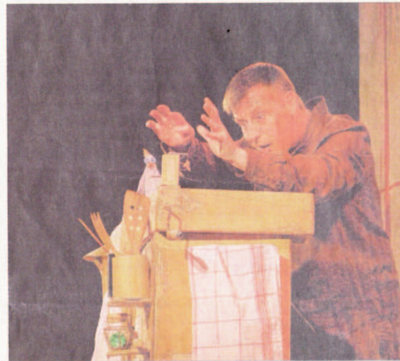
Avec des marionnettes et des ustensiles de cuisine, "la Boîte à trucs" revisite "Ma petite poule rousse".

Le livre-CD "Ma petite poule rousse" est disponible à la librairie Point-Virgule à Villefontaine.